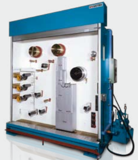
RC 160 | 220 | 250 | 350